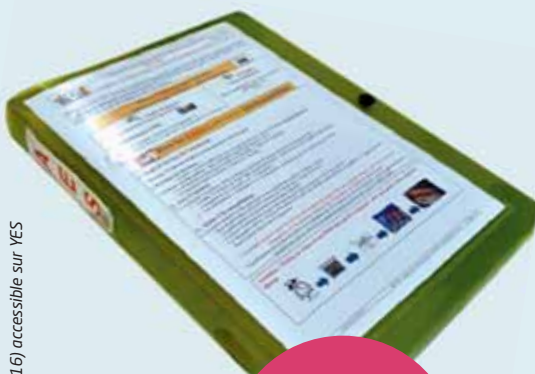
*Procédure KIT AES (noût 2016) accessible sur YES

PROTECTION = RESPECT DES PRÉCAUTIONS STANDARD + MATÉRIELS DE SÉCURITÉ + VACCINATION