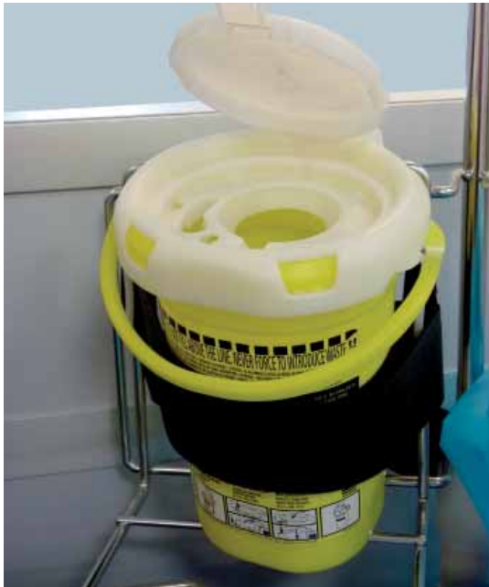
Les collecteurs au CHT ont un système de fermeture temporaire.