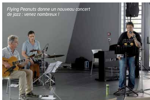
Flying Peanuts donne un nouveau concert de jazz : venez nombreux !

Le Grand Hall accueillera à partir du 19 novembre À l'origine , une exposition de Corinne Belgeri Jusiak sur le thème de la vie, du temps, de l'humain... L'exposition photographique d'Éric Dell'Erba sur le festival Waan Danse de 2016, L'œil et le mouvement , habille toujours les murs de l'Interpôle.