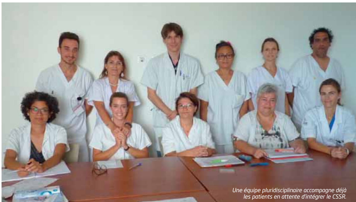
Une équipe pluridisciplinaire accompagne déjà les patients en attente d'intégrer le CSSR.